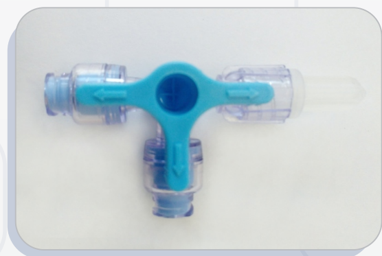
20266 TRO Venoflow BR 3 Vias Alto Fluxo Bivalvulada