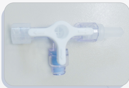
20258 TRO Venoflow BR 3 Vias Alto Fluxo Monovalvulada